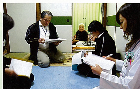
患者様宅でのケアマネージャー主催のサービス担当者会議