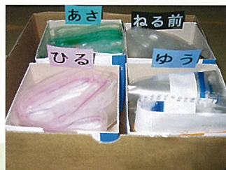
“飲み方”に分けて整理します