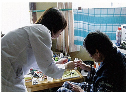
1回分のくすりを確認しながら手渡しています