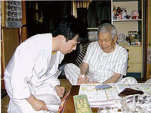
患者様宅でわかりやすく丁寧にくすりの説明