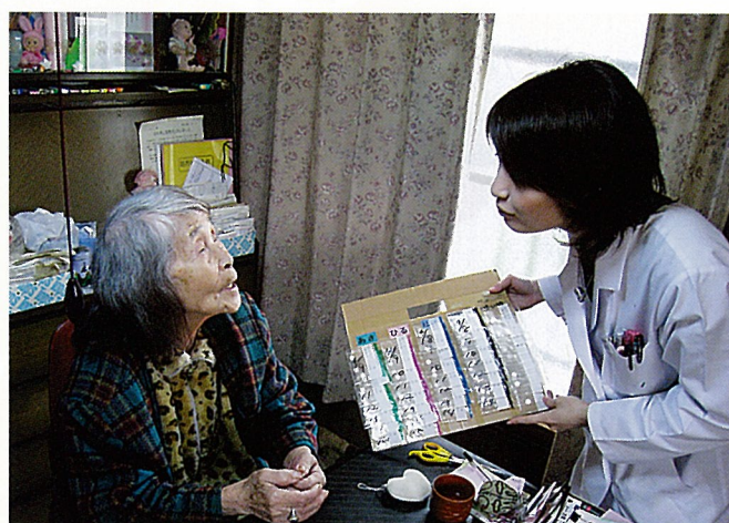
おくすりカレンダーにして日付をいれて飲み忘れや、飲み間違いを防いでいます